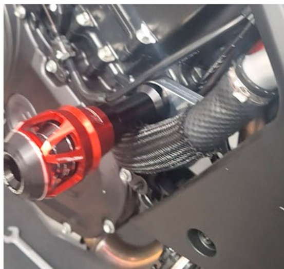
Lado Direito: Slider fixo no quadro

Posicione o suporte conforme a foto; No caso do suporte do lado direito, observe que o mesmo por traz da mangueira do radiador Utilize os parafusos que acompanham o Slider e rosqueie utilizando as porcas originais da motocicleta. Ao final certifique que ambos os parafusos estão bem apertados