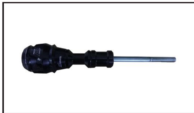
Lado Esquerdo: Slider com base maior

SLIDER DIREITO : Retire os parafusos originais, fixando os sliders no lugar ;