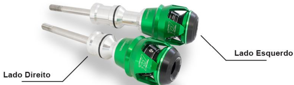
Foto do Produto

Antes de iniciar a instalação leia inteiramente este manual – o suporte segue previamente montado para facilitar o procedimento;