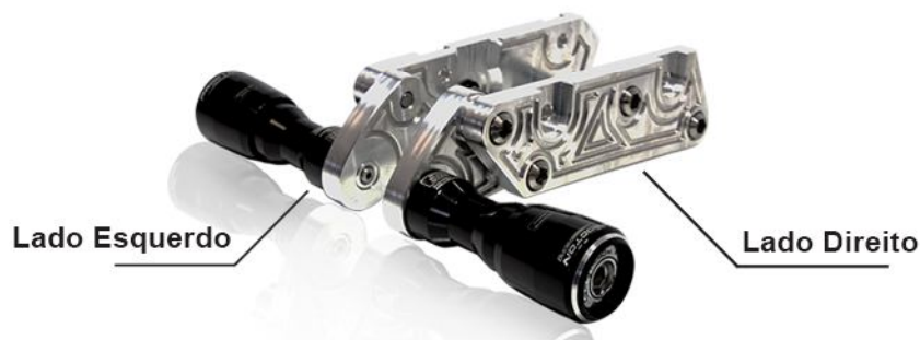
Foto do Produto

ATENÇÃO INSTALADOR: LEIA ATENTAMENTE ESTE MANUAL, É IMPORTANTE SEGUIR A SEQUÊNCIA DE MONTAGEM ATÉ O FIM, CONFORME O DESCRITO.