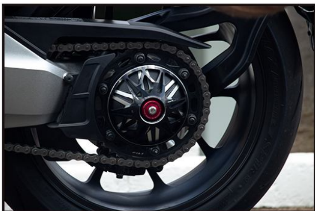
Lado Esquerdo: Cabeça de impacto lado esquerdo

IMPORTANTE: Para evitar que se solte com a trepidação, recomendamos o uso de cola trva rosca