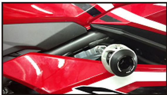
Lado Direito – Suporte e Slider ;

Antes de iniciar a montagem leia este manual – instale um lado por vez;