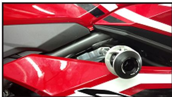
Lado Direito – Suporte e Slider ;

Antes de iniciar a montagem leia este manual – instale um lado por vez;