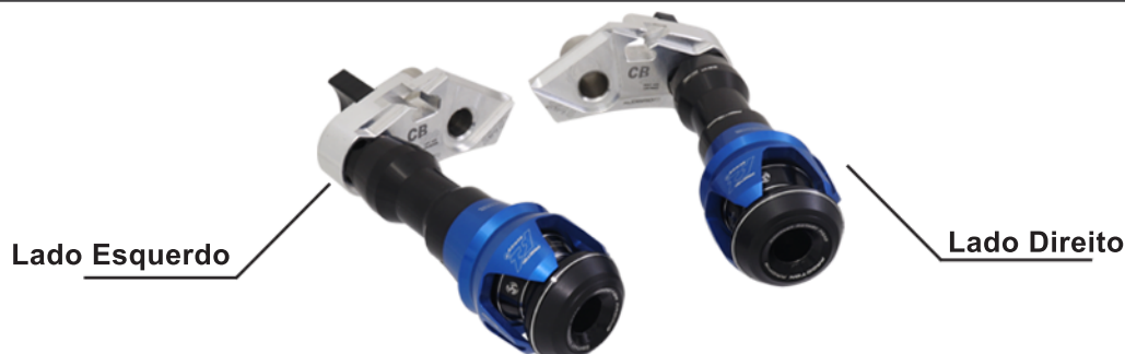
Foto do Produto

Antes de iniciar a montagem leia este manual – instale um lado por vez;