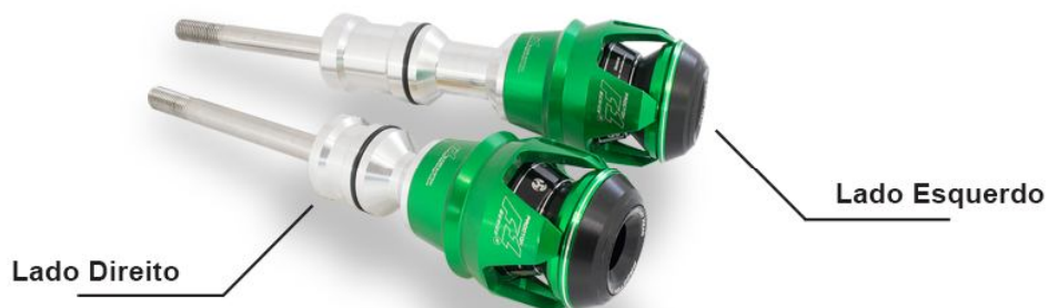
Foto do Produto

Antes de iniciar a instalação leia inteiramente este manual – o suporte segue previamente montado para facilitar o procedimento;