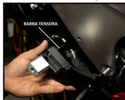
Foto 2: Lado Esquerdo – Neste lado será necessário um leve esforço para o encaixe do suporte;

1) Lado DIREITO: Retire o parafuso original e direcione o suporte para efetuar o encaixe - a Bucha espaçadora em evidência na foto é um componente original da moto , a mesma deverá permanecer na posição;